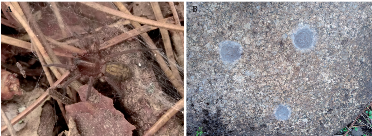
Figure 4.- Aterigena soriculata : habitus de la femelle (Bavella) et cocons sous une pierre (lac de Créno).