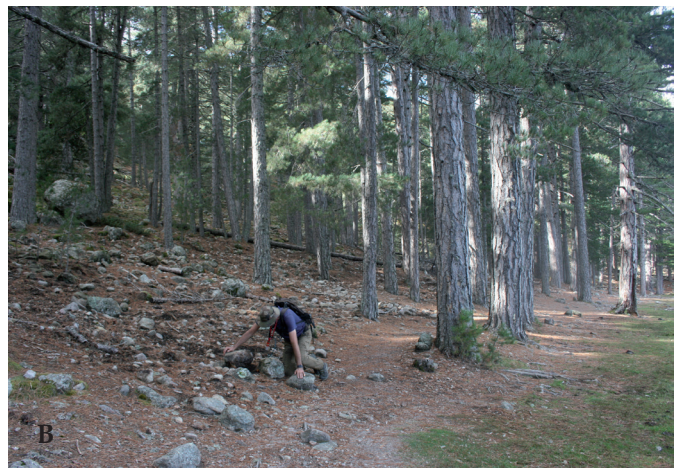
Figure 2.- Lac de Créno (A) et forêt de résineux périphérique (B).