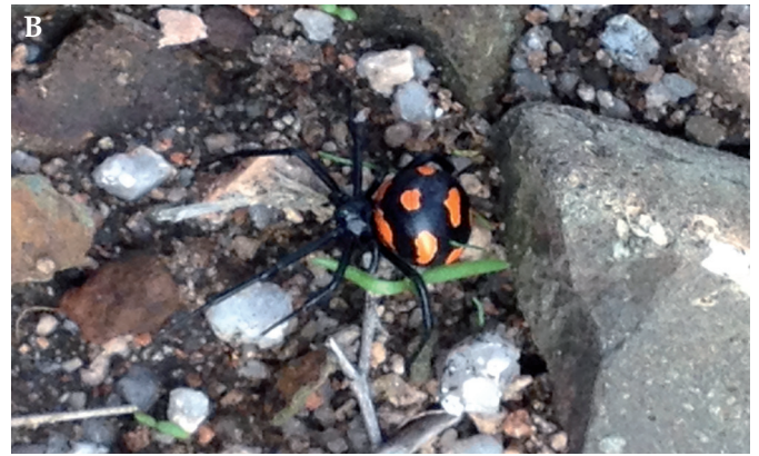
Figure 5.- Différents habitus de Latrodectus tredecimguttatus : A, pelouse steppique de Porto-Vecchio (2021) ; B, plateau rocheux de l'Ospédale (2015) (photos : S. Déjean).