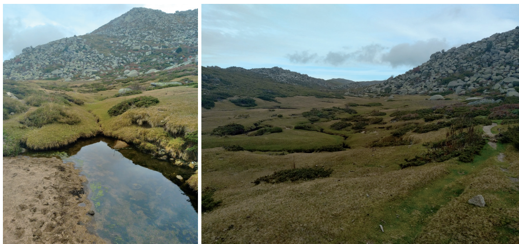
Figure 1.- Plateau de Coscione (Serra-di-Scopamène) avec Pozzines caractéristiques.

Corse-du-Sud : Sari-Solenzara, friche thermophile d'Olmiccia, Dvac, 1M, le 21/10/15, leg. Déjean S. L'espèce est très largement répartie et ne présente